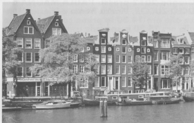
Canale di Amsterdam

Si accede alla Villa con una piacevole passeggiata di 1 chilometro oppure con traghetto.